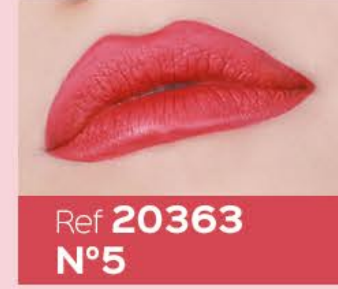
Ref 20363 N°5