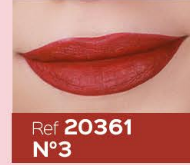
Ref 20361 N°3